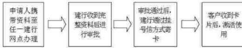
申请人需提供资料一览表